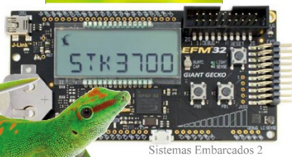
Sistemas Embarcados 2