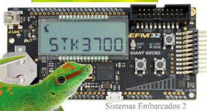
Sistemas Embarcados 2